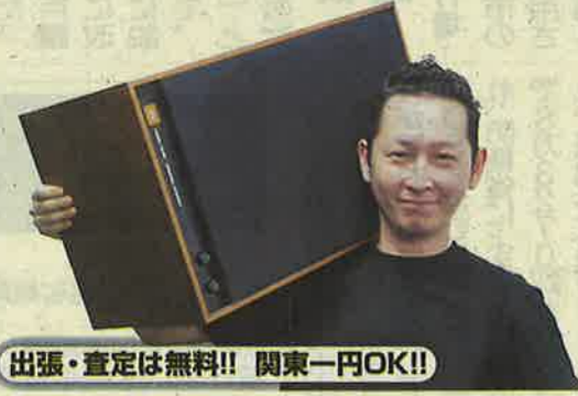
出張・査定は無料!! 関東一円OK!!

創業90年「高久織物」は、テレビでも紹介された伝統工芸「手描き江戸友禅」の高級衣服製造所。今回、正絹高級手描き本振袖、訪問着、黒・色留袖、小紋、袖の表地を各6名、合計30名様に抽選でプレゼント。 【応募先】高久(たかきゆう)織物「毎日」係 〒116-0002 東京都荒川区荒川3-61-4 TEL.03-3690-7820